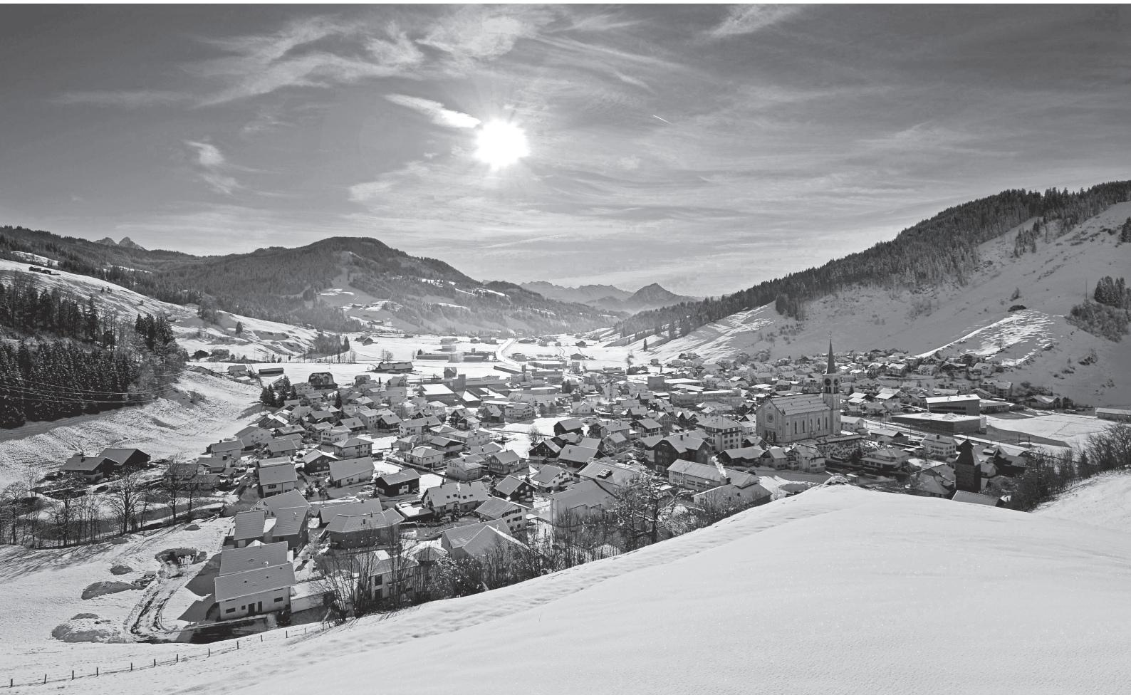
Blick von der Weid auf Rothenthurm